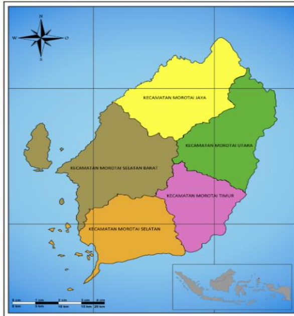
Gambar 2. Peta Wilayah Kabupaten Pulau Morotai

Wilayah kerja Loka POM di Kabupaten Pulau Morotai