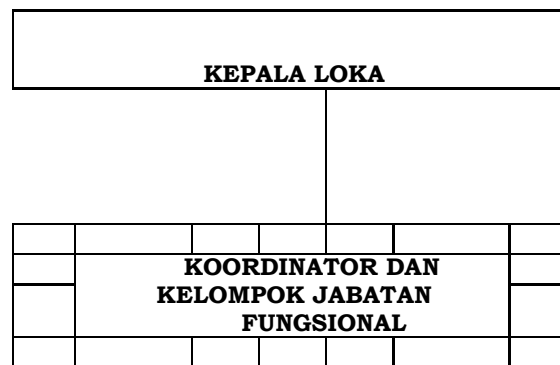
Gambar 1. Bagan Organisasi Loka POM di Kabupaten Pulau Morotai

Bagan Organisasi Loka POM di Kabupaten Pulau Morotai sebagaimana dimaksud adalah sebagai berikut: